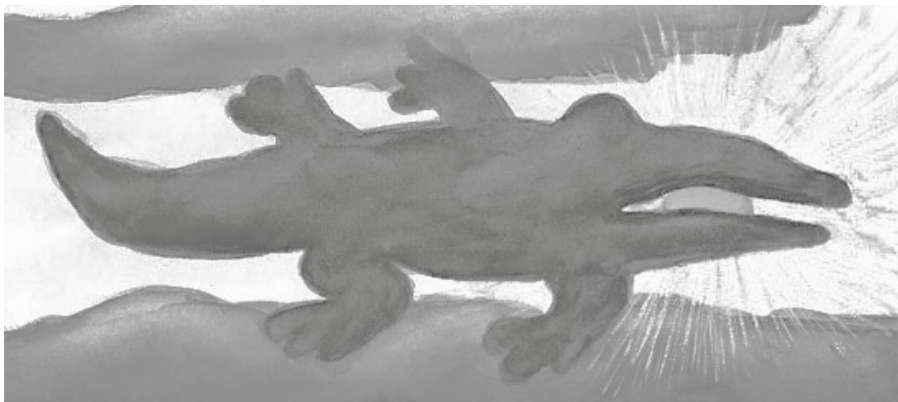
Рис. 1: Горе! Горе! Крокодил / Солнце в небе проглотил!

Перед вами фрагмент известной иллюстрации к стихотворению Корнея Чуковского.